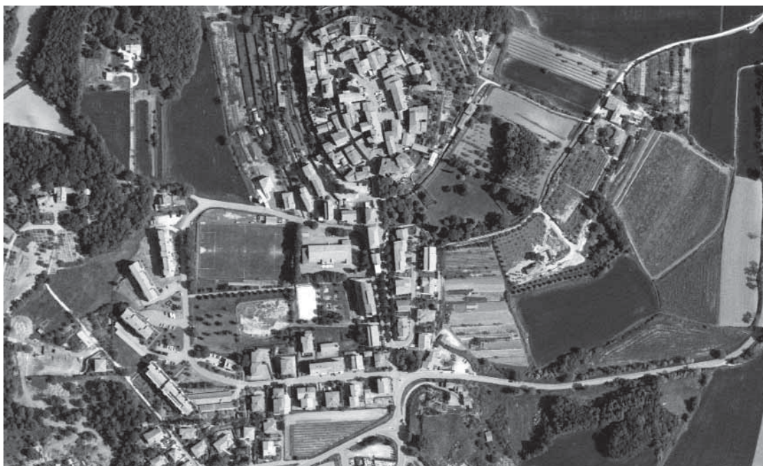
Sovicille, città storica e crescita recente a confronto

Come si può notare si hanno definizioni e aspetti complessi che rinnovano anche il linguaggio tradizionale dell'urbanistica, non hanno un'immediata prefigurazione e prevedono un allargamento degli orizzonti disciplinari.