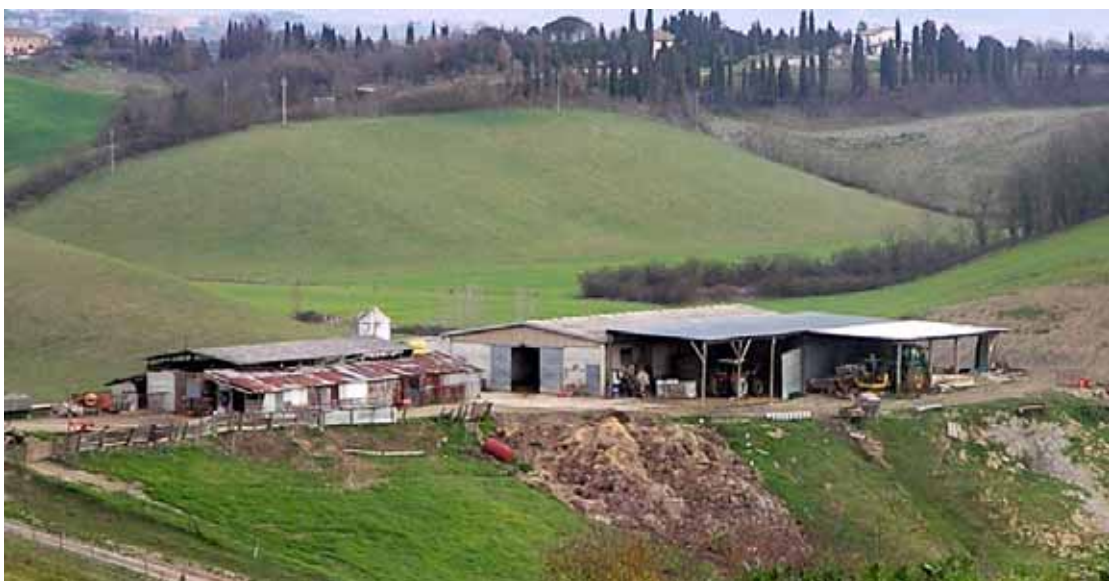
Una località con strutture rilevate appartenenti a tutte le tre tipologie