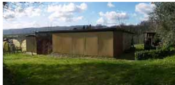
Esempi di strutture rilevate appartenenti alla terza tipologia