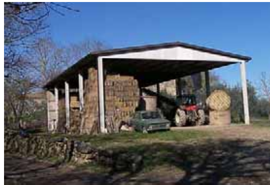
Esempi di strutture rilevate appartenenti alla seconda tipologia