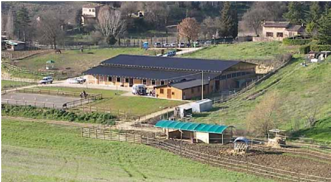
Le strutture del centro Le Bollicine presso l’Agresto

Il restante 8% del volume totale è di conseguenza costituito da manufatti di ridotte dimensioni, inferiori a 1.000 mc, che interessano 46 località anche queste equamente distribuite (2 – 3 %) fra i Subsistemi A, B, e C, e pressochè assenti nel Subsistema D.