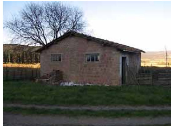
Tre esempi di strutture appartenenti alla prima tipologia