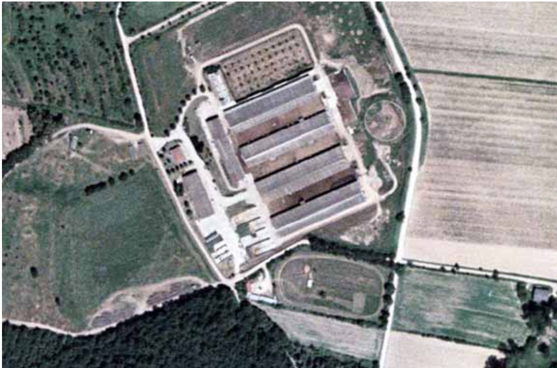
il complesso degli allevamenti bovini presso Orgia

Per il primo gruppo di strutture indagate (stalle, cantine, silos, edifici industriali in aree rurali) è interessante notare come in quest'ambito territoriale si registra il valore più elevato della volumetria dell'intero territorio comunale, ben 90.718 mc pari al 33% del totale complessivo di questa tipologia, distribuite in sole 12 località. Volume costituito essenzialmente dalle strutture dismesse del Mulino Serravalle nell'area della valle del Merse interna al SIR 92, e - per la maggior parte - dalle Stalle di Orgia