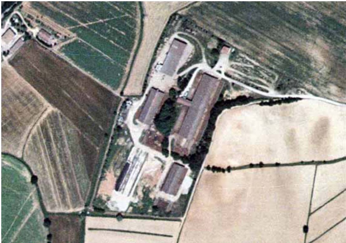
Il complesso della Stalla sociale presso Ampugnano

Nel subsistema "B-Pianura storica", che coincide senza ulteriori suddivisioni con il Piano del Padule, sono state rilevate strutture a carattere permanente in 47 località. Dalla tabella si vede come si mantenga tendenzialmente lo stesso scarto tra la consistenza volumetrica delle strutture appartenenti al primo gruppo tipologico (mc 77.714) e le altre tipologie di manufatto rilevate (mc 43.856 e mc 6.999) con una netta prevalenza di quelle del primo tipo. Analizzando nel dettaglio i dati emerge la presenza di tre grossi complessi rurali: la stalla sociale di Ampugnano, il Consorzio della Maidicola e il Consorzio agrario di Rosia, che da soli costituiscono con circa 43.300 mc il 55% del volume totale presente nell'area. Per il secondo gruppo tipologico (tettoie) è stato rilevato un volume complessivo di mc 43.856, localizzato in massima parte (25.000 mc) nelle stesse tre località sopra indicate, mentre il terzo gruppo registra una volumetria poco consistente con 6.999 mc. In realtà, come si vedrà meglio in seguito, in quest'area sono concentrate un numero elevato di piccole strutture precarie e/o permanenti ad uso ortivo e ad uso non rurale presenti all'interno di quelle zone, non oggetto di rilievi, che abbiamo in precedenza definito "aree di degrado".