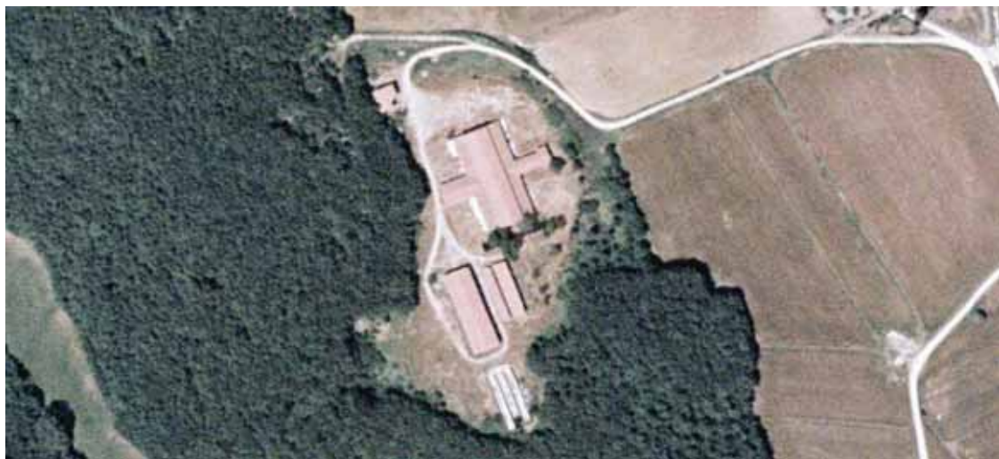
Il complesso in disuso dell'allevamento presso Poggiaccio

Il volume totale relativo al secondo gruppo tipologico (tettoie) è di circa mc 27.000 - pari a circa il 25% del volume totale della tipologia - e la maggiore concentrazione si registra nell'area 2 "Montagnola", con 17.416 mc. Nell'area 1 "pianura occidentale" sono stati computati solo 3.758 mc mentre 5.678 mc nell'area 3 "Rilievi della Val di Merse".