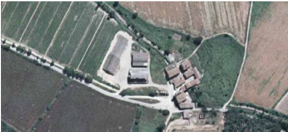
Due immagini delle strutture in disuso presso Serravalle

Un'ulteriore analisi può riguardare le dimensioni delle volumetrie rilevate nelle varie località. Questa valutazione sarà limitata alle strutture a carattere permanente appartenenti al primo gruppo (stalle, cantine, silos, edifici industriali in aree rurali).