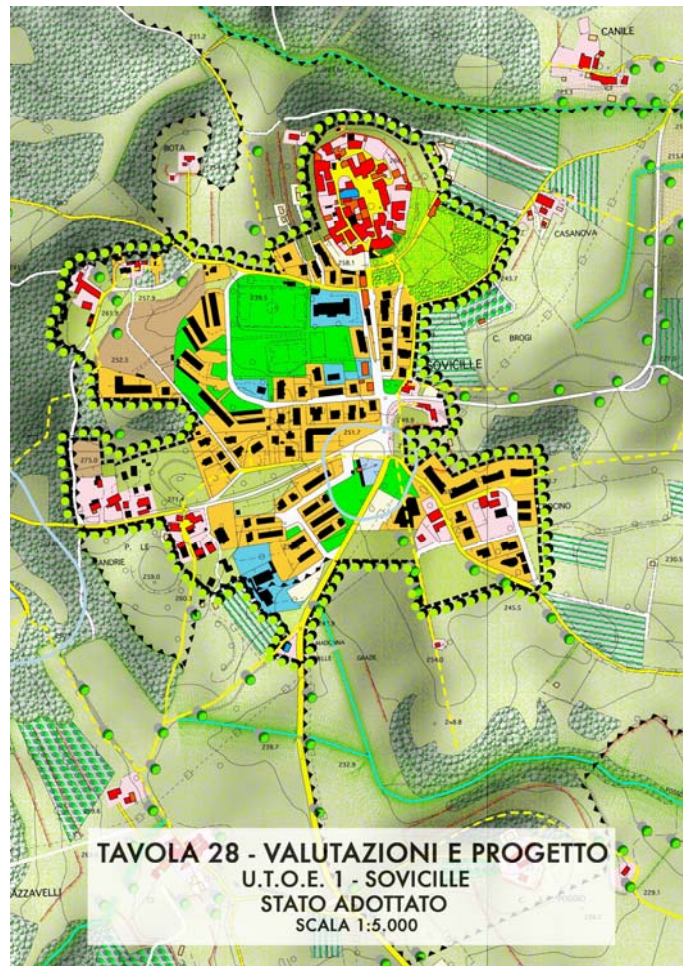
TAVOLA 28 - VALUTAZIONI E PROGETTO U.T.O.E. 1 - SOVICILLE STATO ADOTTATO SCALA 1:5.000